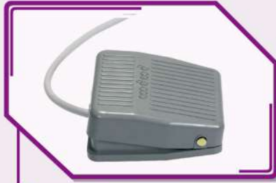
Pedal de Asistencia