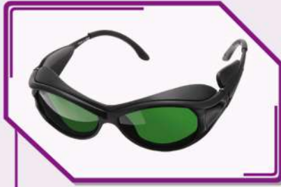
Gafas de Protección Operador