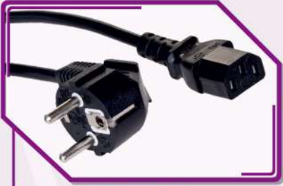
Cable de Alimentación