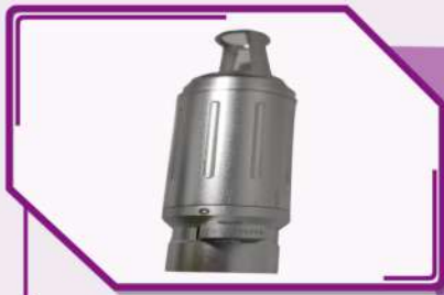
Cabezal 1064nm y 532nm